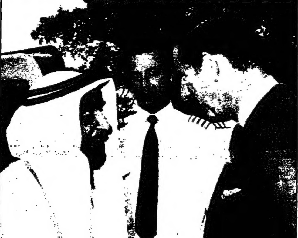
الشيخ زايد يلتقي الأمير تشارلز... والامارات العربية المتحدة...